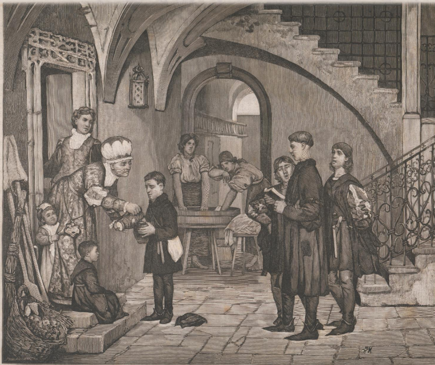
Żacy krakowscy kwestujący w sieni kamienicy przy ul. Sławkowskiej 4, rys. Julian Maszyński, ryt. Kazimierz Pomianowski. Kłosa (1878)

Kłosa 1878. 1-346. Żacy krakowscy kwestujący. Podług obrazu J. Maszyńskiego, z Wystawy Obrazów T. Z. S. P. w Król. Pol.