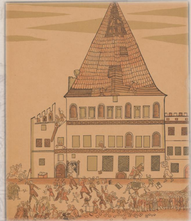
Zburzenie Zboru Ewangelickiego zwanego Brogiem przy ul. św. Jana w 1574 r. w czasie napadu i niszczenia jego wnętrza oraz palenia księgozbiorów przez studentów krakowskich, lit. M.Salba, 1880 r.

Narwicie, co wam trzeba, tylko nie strzelajcie!