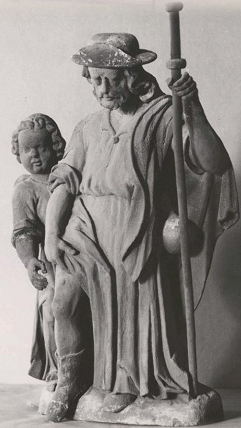
Szpital scholarów pod wezwaniem św. Rocha (Dom pod Krzyżem) z 1474 roku ul. Szpitalna 21