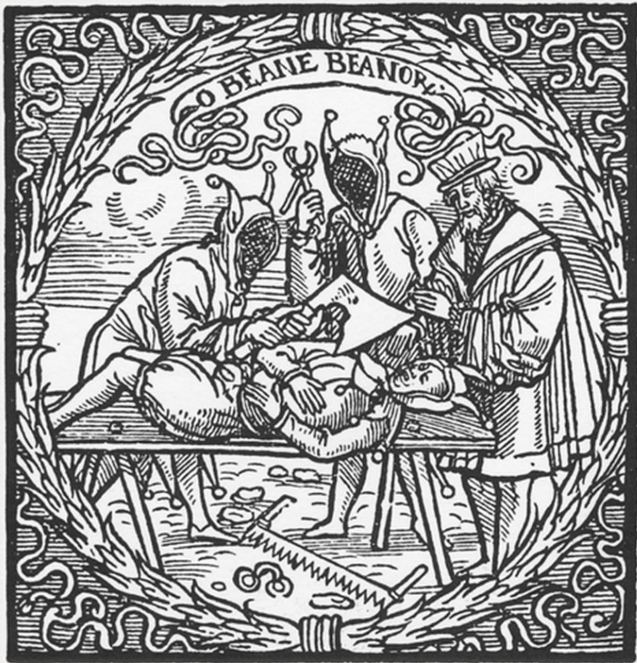
Akademische Deposition - Deposito Beatorum, 1578, Archiwum Uniwersytetu w Wiedniu

7. Lipca 1835 Zburawli ten Dom do my Bona Pauperum na Wislny Wlicy od rogulstwy Golstwy