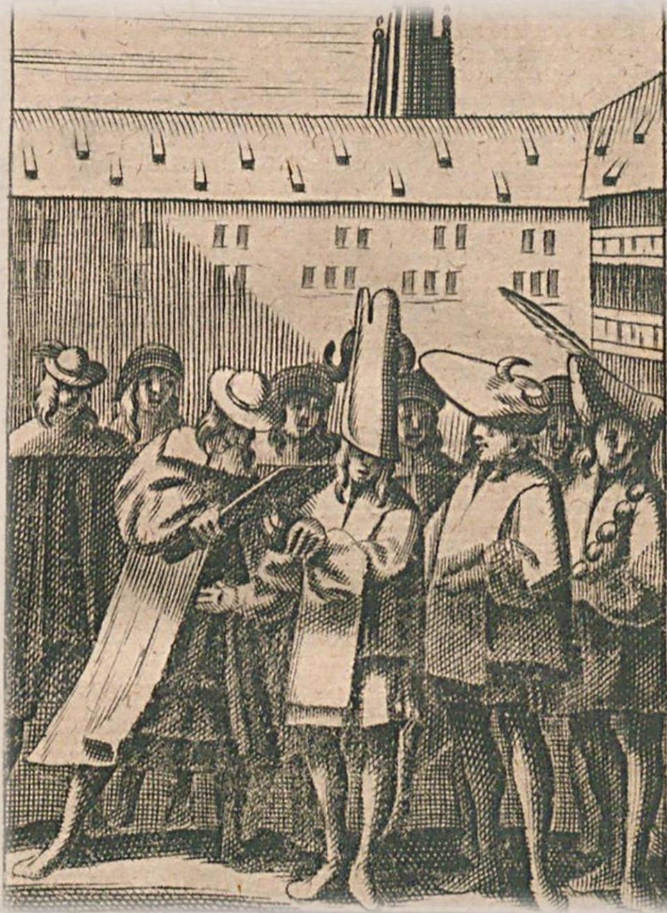
Orationes Duae, De Ritu & Modo Depositionis Beanorum, Strasburg 1680